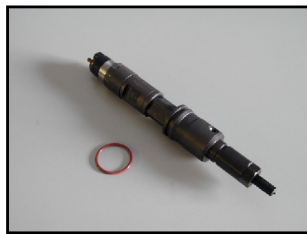
Iniettore Autocarro Ø32 (Renault Premium 420)