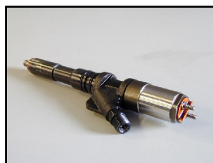
Iniettori Common-Rail Nippondenso ECD-U2 tipo John Deere e Komatsu