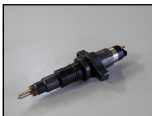
Iniettore Autocarro Ø26 (Renault Premium, Iveco Tector, ect.)