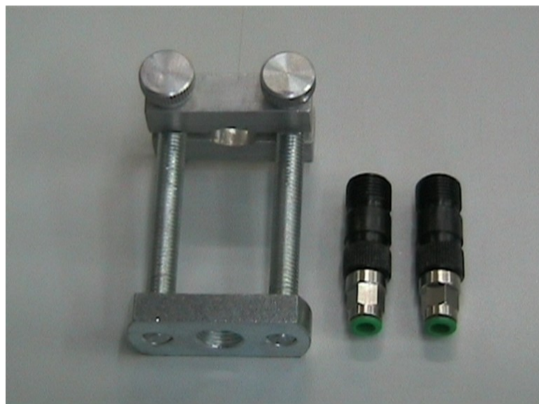
COD.: KIT MRS1*

Il Kit è composto da un morsetto elettroiniettore e 2 attacchi per pulverizzatore da 7,6 e 9,50 mm.