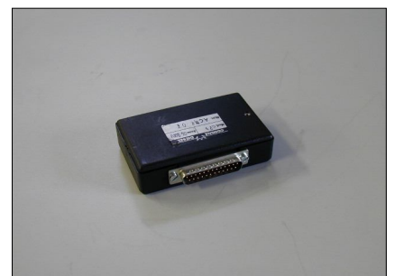
Software CP3-Siemens - Delphi COD.: ACME07