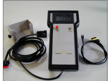
Tester regulador COD.: 555-41-2