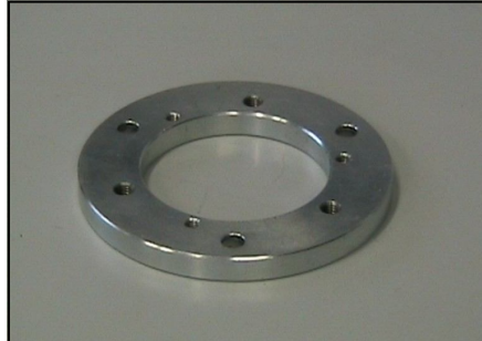
Flangia Mercedes* COD.: 555-11