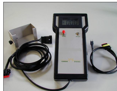
Captatore Lavoro regolatore COD.: 555-41-2