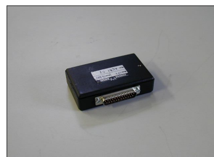
Software CP3-Siemens - Delphi COD.: ACME07