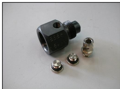
Raccordo alta pressione per rilevazione portata da PCV COD.: 555-6A/N