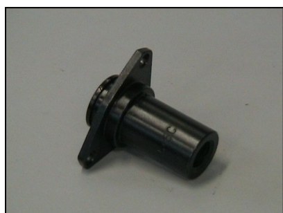
Raccordo pressione trasferta COD.: 555-6C