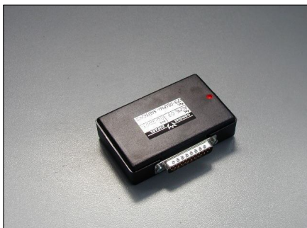
Software CP3 - Siemens- Delphi COD.: ACME07