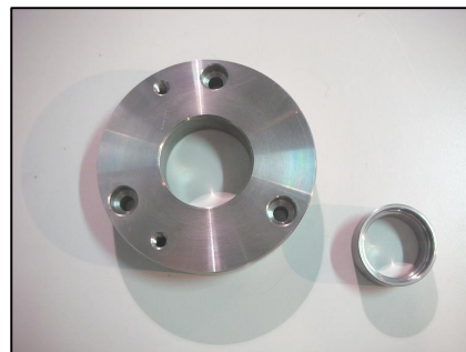
Flangia banco prova COD.: CDFDP32