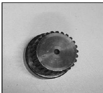
Giunto di trascinamento con millerighe COD.: 555-14ND