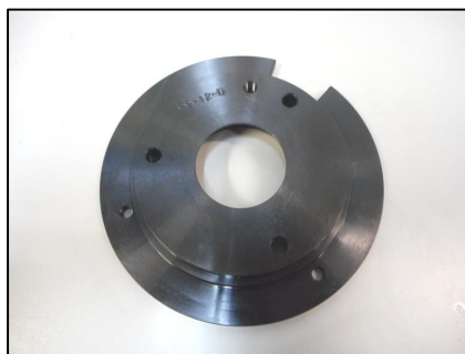
Flangia banco prova COD.: 555-12-D