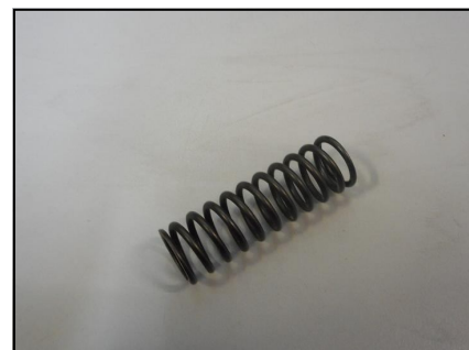
Molla per giunto COD.: 555-12-E