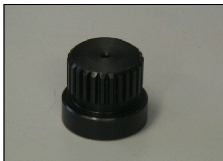
Giunto di trascinamento con millerighe COD.: 555-14N